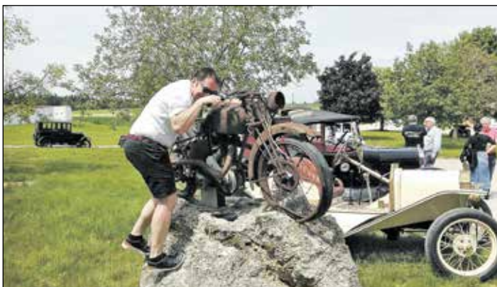
Ziel der Ausfahrt war das Motorradmuseum in Peintal. Erst wenige Tage zuvor hatte dort das Meet & Greet der BMW-Freunde stattgefunden.

1913 revolutionierte die industrielle Fertigung des Ford Model T die Autoindustrie - es wurde erstmals am Fließband produziert. Insgesamt wurden mehr als 15 Mio. Ford Model T's verkauft und die „Tin Lizzy“ war damit das meistverkaufte Auto der Welt. Dieser Titel wurde dem Ford Model T erst in den 70er Jahren vom VW Käfer abgenommen.