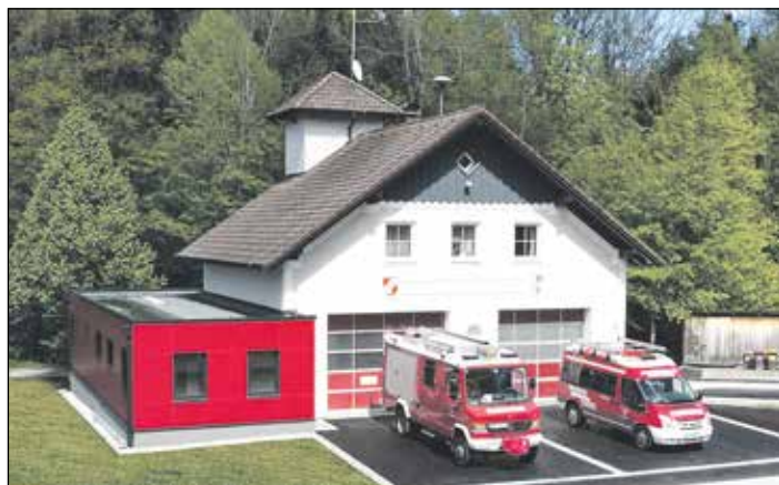
FF Feichtenberg zählt 56 Mitglieder, davon drei Frauen, und feiert vom 28. bis 30. Juni den Erweiterungsbau in der Hagenmühle mit einem Fest.

Der im Herbst des Vorjahres begonnene Zubau zum bestehenden, 1995 errichteten Feuerwehrraum im Kirchhamer Ortsteil Hagenmühle ist fertiggestellt und wird bei den Feuerwehrfesttagen offiziell eröffnet. Die Erweiterung war dringend notwendig, da die Spinde der FF-Mitglieder bislang noch immer in den Garagen direkt neben den Fahrzeugen platziert und die Platzverhältnisse keineswegs mehr zeitgemäß waren.