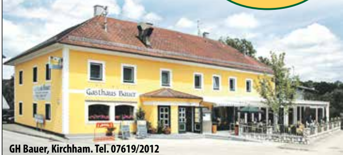
GH Bauer, Kirchham. Tel. 07619/2012