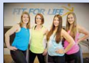
Tipp vom Fit for Life-Team