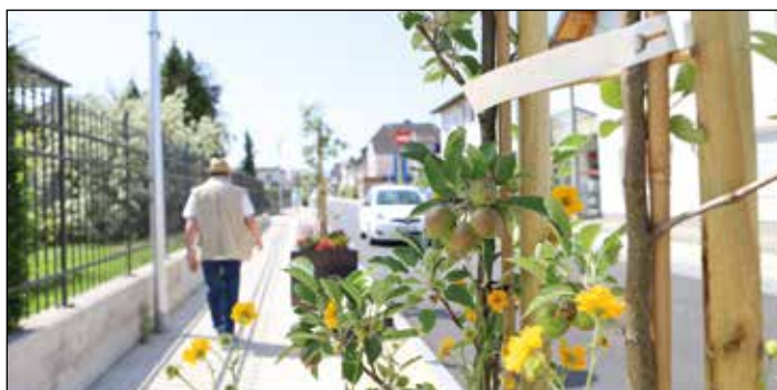
Blumen und Nutzpflanzen flankieren die neu gestaltete Bahnhofstraße.

Neben der Pflanzenvielfalt hat der Gemeindebauhof acht Sitzbänke installiert. Prototypen wurden bereits vor einem Jahr für den Sportplatz gefertigt und sind dort ebenso lange erfolgreich getestet worden. Nun wurden die Sitzbänke auch für die Bahnhofstraße nachproduziert. Bepflanzung und Sitzmöglichkeiten waren bereits in der Konzeption der neuen Bahnhofstraße vorgesehen und bilden nun den letzten Feinschliff des Sanierungsprojektes.