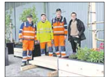
Bauhofmitarbeiter bauten die Blumentröge zusammen, die Bepflanzung übernahm die Gärtnerei Leithinger bzw. „Sträußerl“.

die Bepflanzung, die markanten Spalierbäumchen kommen von der Vorchdorfer Baumschule Niedrist. Wer genau hinschaut, kann Gewürze wie Rosmarin, Salbei aber auch Basilikum, Thymian oder Sauerampfer entdecken. Dazwischen mischt sich ein Traum für Bienen bestehend aus Salvien, Strohlumen, australischen Gänseblümchen oder Verbenen. Winterfeste Stauden ergänzen das Angebot für die fleißigen Honigproduzenten. Pro Trog wurde ein Spalierbaum