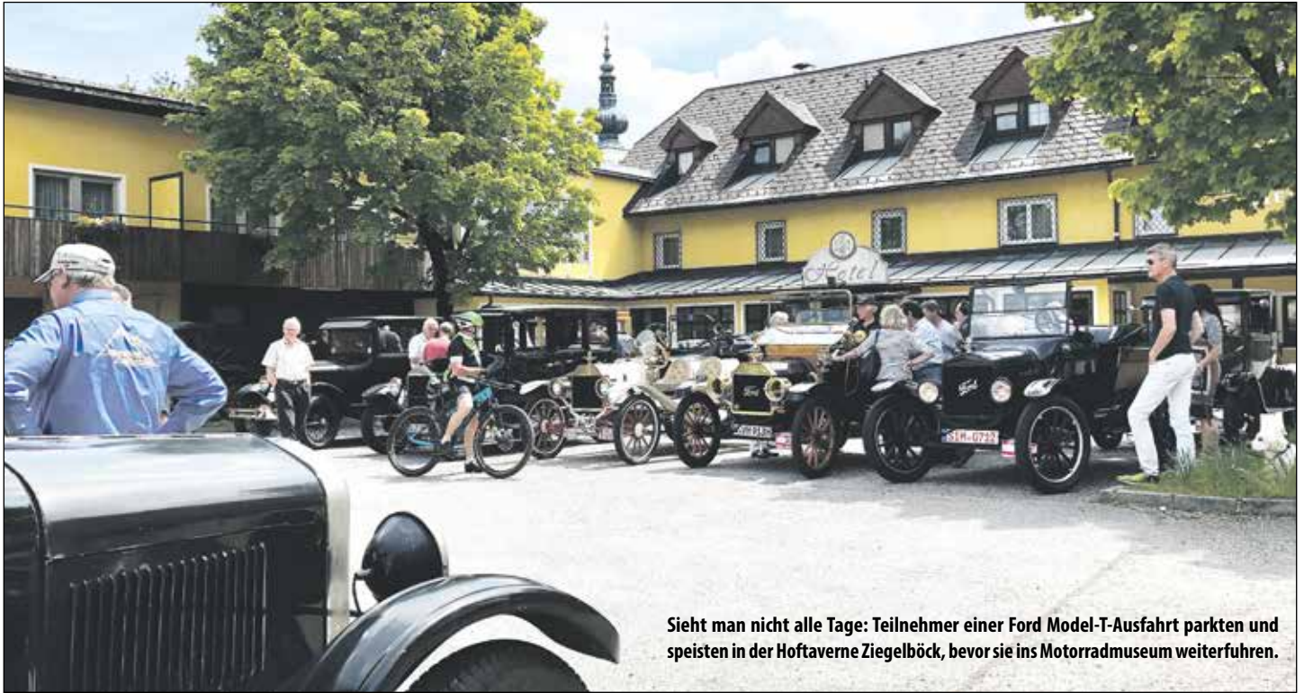
Sieht man nicht alle Tage: Teilnehmer einer Ford Model-T-Ausfahrt parkten und speisten in der Hoftaverne Ziegelböck, bevor sie ins Motorradmuseum weiterfahren.