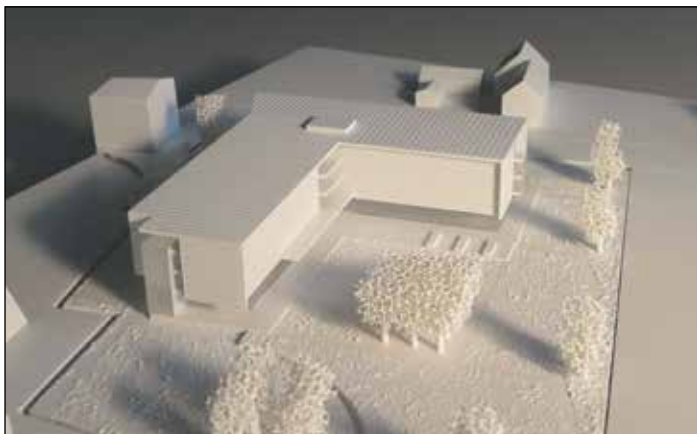
Das winkelförmige Gebäude öffnet sich nach Süden. Mit der Ausrichtung zum Traunstein bildet der Neubau einen klaren Außenraum im Grünen.

Weiters hat der Architekt optional eine Tiefgarage für Mitarbeiter vorgeschlagen und skizziert. Die ausgezeichnete Durcharbeitung des Projektes wird von der Fachjury besonders hervorgehoben.