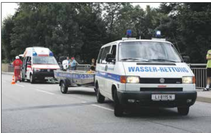
Im Jahr 2014 wurde für Vorchdorf ein KDH-Boot abgestellt. Dadurch sind die Vorchdorfer Wasserretter im Hochwasserfall möglichst schnell oberösterreichweit im Einsatz.