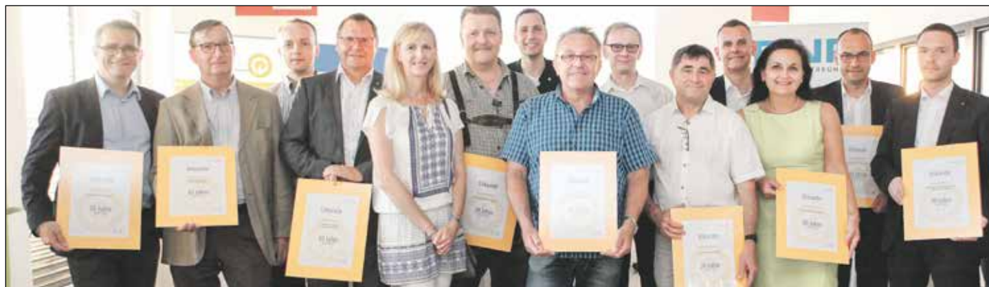
Der Vorchdorfer Werbering ehrte im Rahmen seiner Jubiläums-Generalversammlung langjährige Mitglieder.

Zur 30-Jahr-Jubiläums-Jahreshauptversammlung lud der Werbering Vorchdorf seine Mitglieder in die Räumlichkeiten von BNP und Powernetworks. Bei sommerlichen Temperaturen folgten zahlreiche Mitglieder der Einladung und bekamen exklusive Einblicke in die umfangreichen Aktivitäten des Vorchdorfer Werberings.