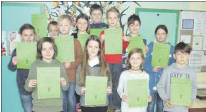
Die Klassensieger des Känguru-Wettbewerbs in der VS Pamet

In den letzten Jahren ist das Känguru der Mathematik in Pamet zu einem Fixpunkt des Schuljahres geworden. Mit jährlich weit über 100 000 Teilnehmer in Österreich gehört dieser Wettbewerb mittlerweile zu den bekanntesten bundesweiten Schulaktivitäten.