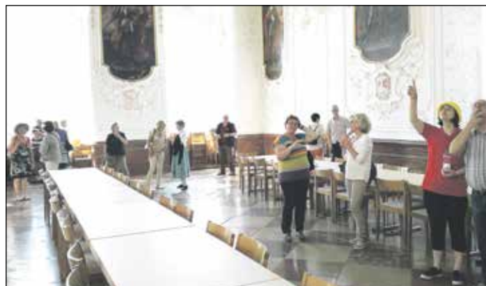
Vorchdorfer Kulturinteressierte im Stift Kremsmünster.

Die zweite Erlebnisfahrt führte am 24. Juni nach Linz. Das Museum NORDICO wurde 1610 erbaut und diente den Äbten des Stiftes Kremsmünster als Stadtpalais. Unter fachkundiger Führung gab es Einblicke in die Archäologie- und Volkskundesammlung mit Objekten der Handwerks- und Handelsgeschichte. Nach einem Mittagessen im „Odysseus“ ging es weiter in das Kunstmuseum LENTOS.