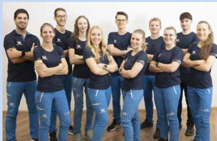
Das engagierte Team von MEIN TRAINING - fachliche Kompetenz und Freude an Bewegung stehen hier im Mittelpunkt.

Jetzt starten und ein kostenloses und unverbindliches Probetraining vereinbaren – telefonisch unter 07614 93041 oder online unter www.mein-training .