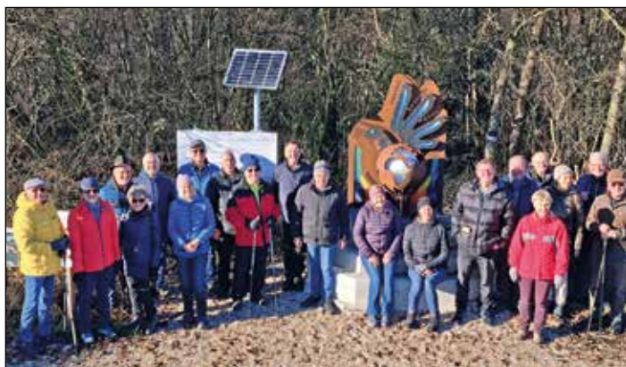
30 Teilnehmer folgten der Einladung zum Wandertag am Themenweg der Menschenrechte in Roitham.

Am 10. Dezember 2025 lud der Kulturerbeverein Traunfall anlässlich des Tages der Menschenrechte ein. Der internationale Gedenktag wurde von der UNO im Jahr 1948 ins Leben gerufen. 2024 errichtete der Verein in Roitham den Themenweg von 5 km als „Arena der Menschenrechte“. Eine fachkundige