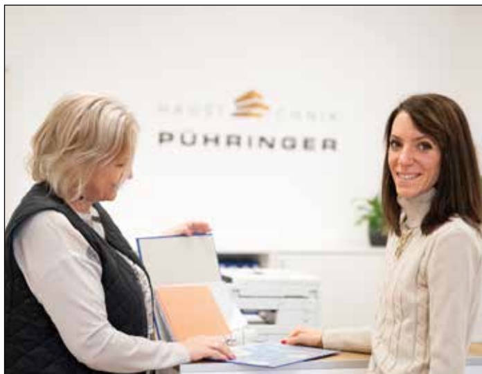
Haustechnik Pühringer setzt Maßstäbe im Gewerbepark mit erweitertem Leistungsangebot und Schauraum.