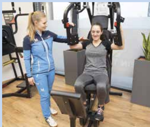
Individuelle Betreuung bei MEIN TRAINING Vorchdorf – korrektes, sicheres Krafttraining unter fachkundiger Anleitung.