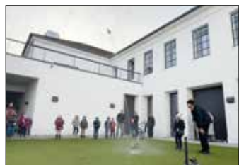
„Raketenstart“ im Innenhof begeisterte die Kindergartenkinder

Am Vormittag tauchten die Kindergarten-Kinder in die Welt der Raumfahrt ein. „Es sind die Kin-