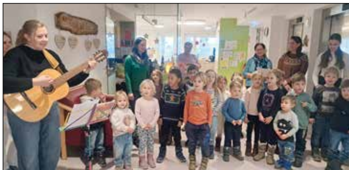
Drei Kindergartengruppen besuchten das Seniorenheim in Vorchdorf und brachten mit Liedern Freude und Vorweihnachtsstimmung zu den Bewohnern.

Groß war die Freude bei Jung und Alt am 18. Dezember im Seniorenheim Vorchdorf. Die Kinder der Hasen-, Sonnenschein- und Regenbogengruppe des Kindergartens sorgten mit ihrem Besuch für eine besonders stimmungsvolle vorweihnachtliche Begegnung. Mit viel Begeisterung präsentierten die Mädchen und Buben ein liebevoll einstudiertes Liederprogramm und brachten damit weihnachtliche