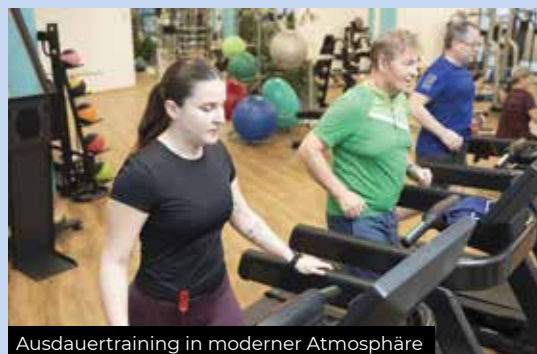
Ausdauertraining in moderner Atmosphäre