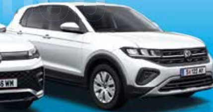
Der neue T-Cross

Jetzt Probe fahren und frühlingshafte Preise sichern.