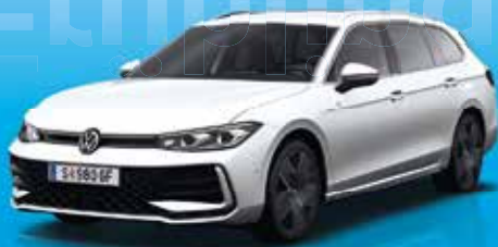
Der neue Passat