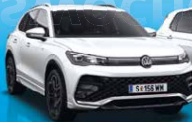
Der neue Tiguan