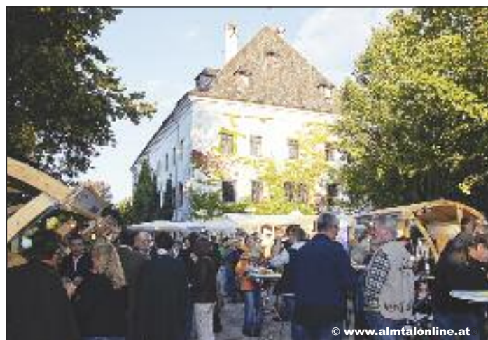
Genussmarkt im Schloss Scharnstein

Nur die besten Schmankerl der Gastronomen wurden präsentiert. Neben dem umfangrei-