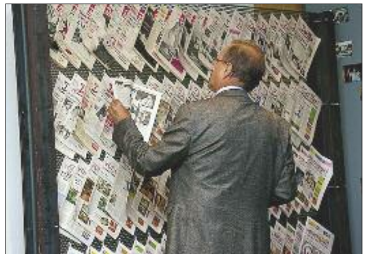
Etwa die Hälfte aller bisher erschienenen Tipps waren ausgestellt und wurden gerne durchgeblättert.

Mitgliedern betreuten Punschstandes vom letzten Advent übergab: € 1.883.64 gehen an die Lebenshilfe Pettenbach.