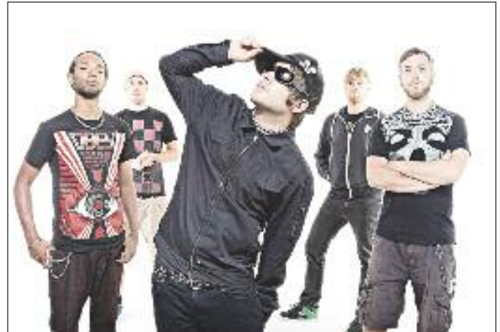
Die Headliner dieses Jahres EMIL BULLS aus München

Dieses Jahr findet auch zum ersten Mal ein Band-Contest unter dem Motto „Battle of the Bands“ statt. Rock- und Metalbands aus Österreich konnten ihre musikalischen Leistungen von 1. Juni bis 31. Juli 2012 auf Facebook einreichen und ihre Fans zum Voting animieren. Die fünf Bands mit den meisten Stimmen gewannen einen Auftritt am „Rock im Schloss“