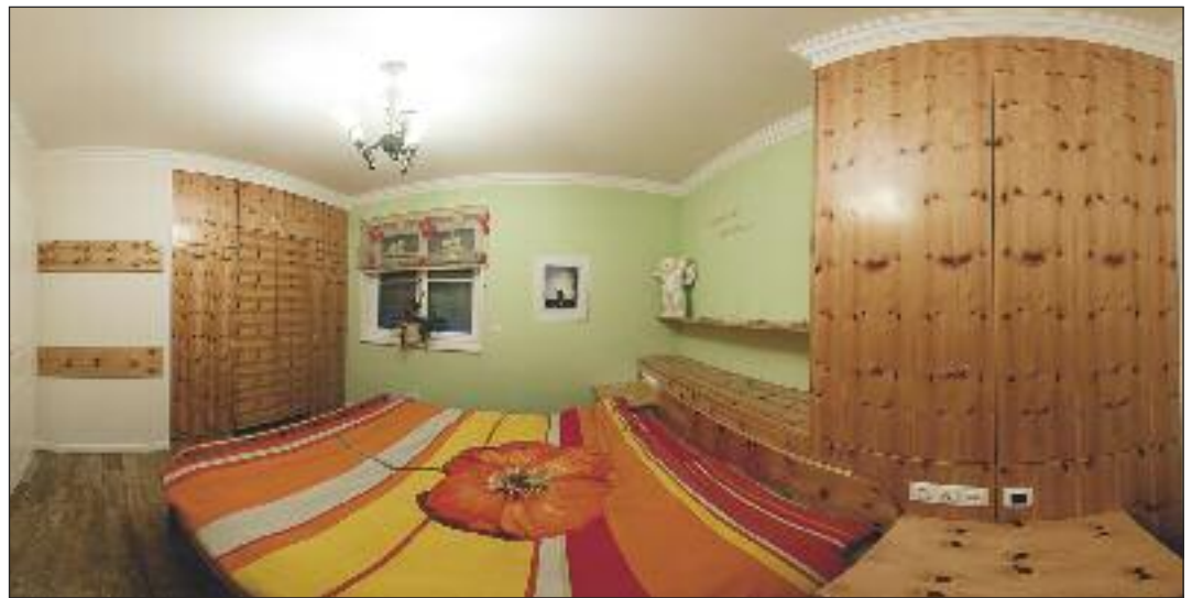
Zirbenmöbel – gut für die Gesundheit – Näheres dazu bei Wohndesign Hubinger!

Eine Eigenschaft von Zirbenholz, die auch Forscher festgestellt haben, ist besonders positiv fürs Wohlbefinden: Zirbenholz in der Wohnumgebung, besonders im Schlafzimmer, senkt die Anzahl der Herzschläge, reduziert somit Stress und bringt erholsameren Schlaf. Auch soll in Zirben-