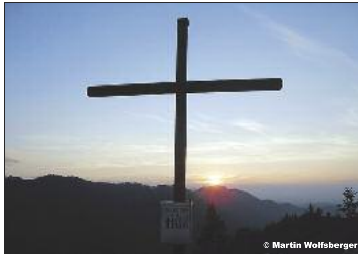
Sonnenuntergang auf dem Schabenreitnerstein, 1143 m

Der Ausgangspunkt befindet sich unmittelbar unterhalb des Graßnergutes auf einem kleinen Parkplatz, der für ca. 10 Autos Platz bietet. Den markierten Wanderweg 445 entlang, immer der Beschilderung Schabenreitnerstein folgend. Anfangs über eine Forststraße, dann über einen Karrenweg der schließlich zu einem Wandersteig wird. Durch schütterten Bergwald empor hinauf zum steinigigen, breiten Bergkamm. Im letzten Abschnitt etwas ausgesetzt über Felsen hinauf zum Gipfelkreuz mit Bank und Buch. Fantastische Rundumsicht ist garantiert. Vom Schabenreitnerstein danach auf einem nur mit Stein-