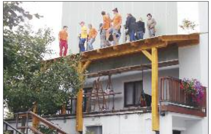
Schon bei der Dachgleiche gingen den Plattlern die Beine durch.

Ein Dank gebührt der Landjugend für ihr Engagement und ihr Mitwirken an der Gemeinschaft.