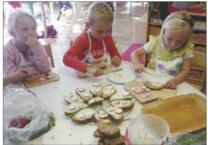
Selbst zubereitete Jause schmeckt doppelt gut!

Dem natürlichen Bewegungsdrang der Kinder wird noch