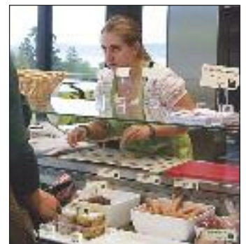
Erste Erfahrung gesammelt am ersten Verkaufstag.

Probieren Sie unsere teilweise von der Schule produzierten Lebensmittel und die Lebensmittel von den umliegenden Direktvermarktern. Der Genussladen hat jeden Mittwoch von 16 - 19 Uhr geöffnet. Die SchülerInnen des ABZ-Salzammerguts und die Lehrergemeinschaft freuen sich auf Ihr Kommen!