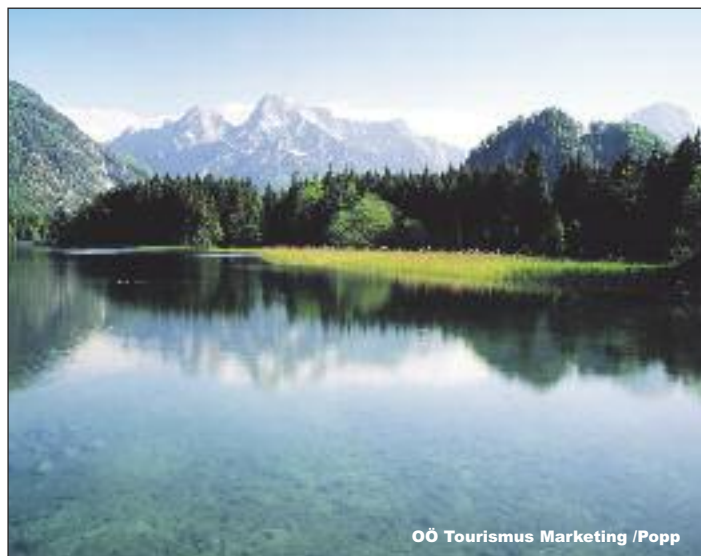
OÖ Tourismus Marketing /Popp

Weiters besteht die Möglichkeit, die Veranstaltung am