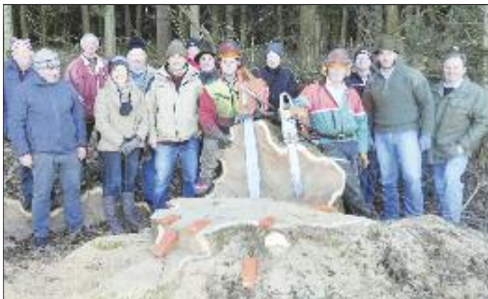
Stolz präsentieren die beiden Forstarbeiter die gefallene Eiche.