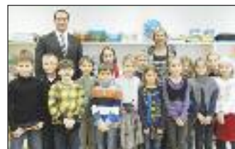
Klasse 2a: Den Schülerinnen und Schülern aber auch den Lehrkräften steht die Freude über das neue Schulgebäude ins Gesicht geschrieben.

Auf die Frage, was den Schülerinnen und Schülern in der neuen Schule besonders gefällt, sprudelten die Antworten nur so heraus. Die Drehsessel mit Rollen, die neue Multimedia-Tafel, die stufenlos höhenverstellbaren Tische, die eigenen Fächer im Kasten, die vielen Fenster, der Turnsaal mit Boulderwand... bis zu "einfach alles" war der Tenor bei den Schülerinnen und Schülern. Die Marktgemeinde Bad