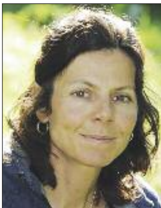
Auch Gerlinde Kaltenbrunner unterstützt das Team.

Selbst Extrembergsteigerin Gerlinde Kaltenbrunner zeigt sich begeistert vom Angebot in Laakirchen. Sie weist im Vorwort des neuen Seminarkatalogs darauf hin, dass der leichteste Weg nicht immer der zielführende ist.