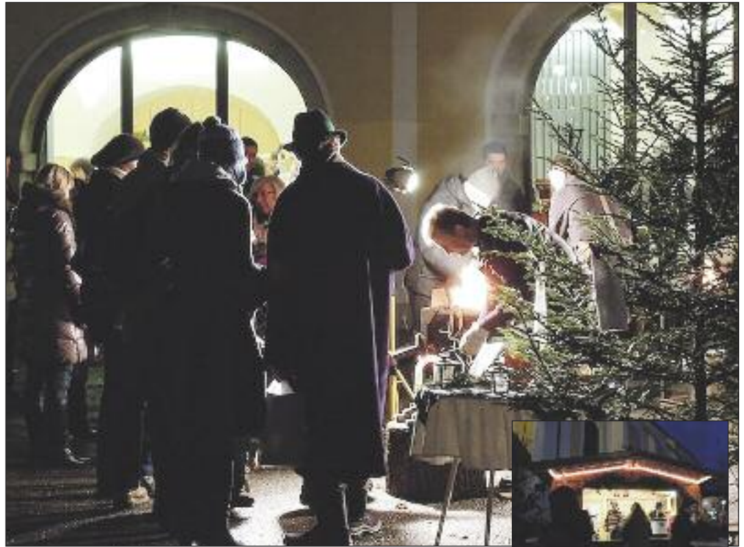
Besonders stimmungsvoll ist es immer am Abend! Das Nagelschmieden war jedenfalls ein besonderer Anziehungspunkt.

Der Christkindlmarkt-Verein hat alles perfekt organisiert und führt damit die liebgewordene Vorchdorfer Tradition in die Zukunft!