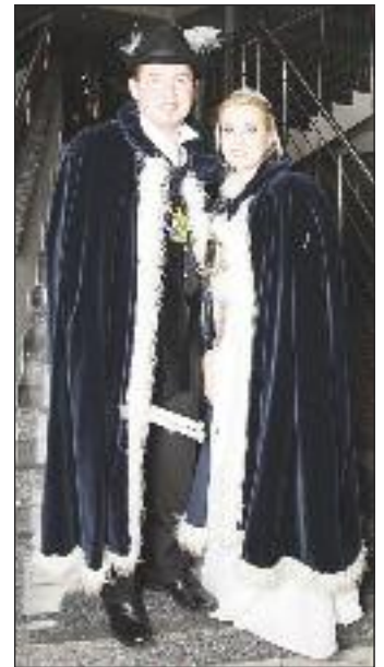
Ihre Hoheit Prinzessin Sarah der schießende Sangeszwerg vom Rabesberg und Seine Hoheit Prinz Thomas I. flink und keck vom Taverneneck