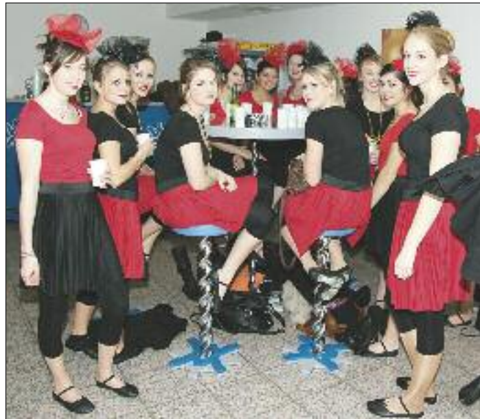
Lauter hübsche Mädels, so weit das Auge reicht, freuen sich auf den Höhepunkt des diesjährigen Faschings!

Vorchdorf und Umgebung hat somit einer Familie ein Dach über dem Kopf geschenkt! Annis Garagenbasar-Öffnungszeiten: jeden 1. Freitag im Monat gegenüber Cafe Zwirn von 14 - 17 Uhr, Tel. 07614/5292