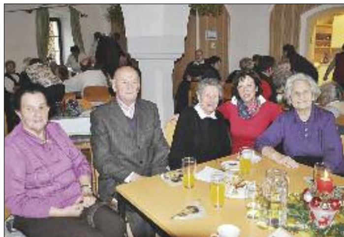
Einen schönen Nachmittag bescherten die Hilfswerk-Mitarbeiterinnen ihren Klienten im Pfarrheim Vorchdorf.