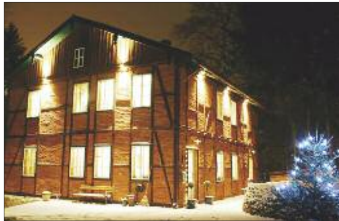
Seminar- und Bildungshaus Villa Rosental – Treffpunkt für außergewöhnliche Seminare

Das umfangreiche Winterprogramm des Laakirchner Semi-