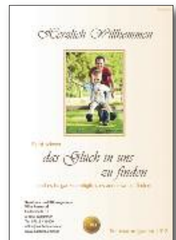
Der umfangreiche und informative Seminarkatalog 2012

Teilnahmeschluss ist der 31. Jänner 2012. Der Rechtsweg ist ausgeschlossen. Gewinne können nicht in bar abgelöst werden.