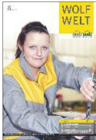
Das Design der neuen „WOLF WELT“ kommt aus Vorchdorf.

Von Scharnstein aus erobert WOLF sozusagen die ganze Welt und überzeugt sie mit sei-