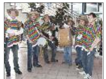
Eine kleine Abordnung der Kirchhamer Musiker.