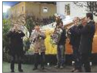
Am Vorchdorfer Christkindlmarkt war der Musikverein ebenfalls mit einer Abordnung vertreten.