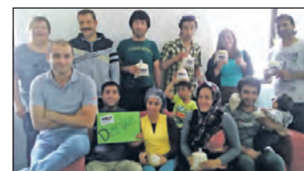
Vorchdorf Weltladen verteilt 100 kg Reis in Vorchdorf, Grünau, Scharnstein und Pettenbach.

„Die große Zuwanderung in Richtung Europa ist ein Zeichen globaler Ungleichheit. Die davon betroffenen Menschen sind die Opfer,“ meint Vitoon Panyakul, Mitbegründer von „Green Net“, einem Zusammenschluss von Kleinbauern und -bäuerinnen aus Thailand, der seit 1998 mit der EZA kooperiert.