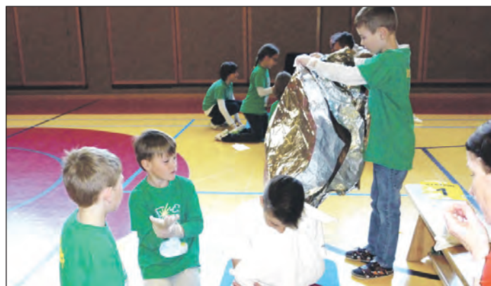
Die Volksschüler aus Pamet zeigten beim Helfi-Bewerb in Altmünster, wie sie als Ersthelfer reagieren.

Der Erste-Hilfe-Bewerb für Volksschulen wird vom Jugendrotkreuz organisiert und fand heuer in der Volksschule Altmünster statt. In acht Praxisstationen und zehn Theoriefragen zeigten die Pameter Schüler, dass sie auf den Ernstfall gut vorbereitet sind. Alle Teilnehmer waren