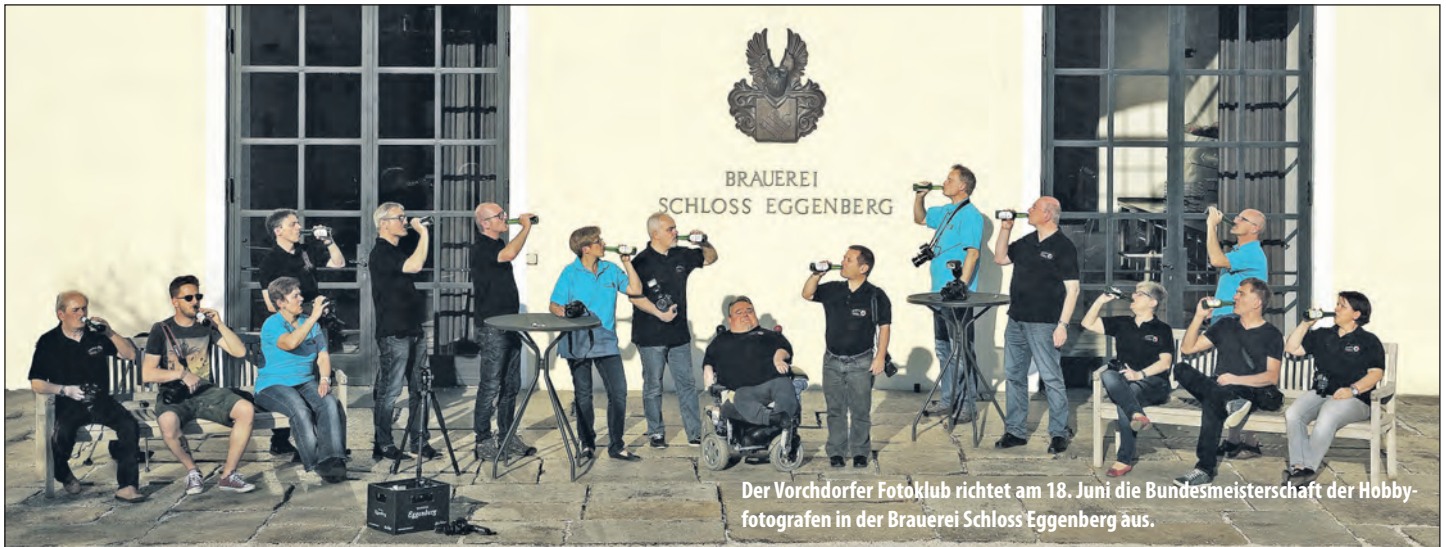
Der Vorchdorfer Fotoklub richtet am 18. Juni die Bundesmeisterschaft der Hobbyfotografen in der Brauerei Schloss Eggenberg aus.

Bundesmeisterschaft der Naturfreunde-Fotografen in Vorchdorf