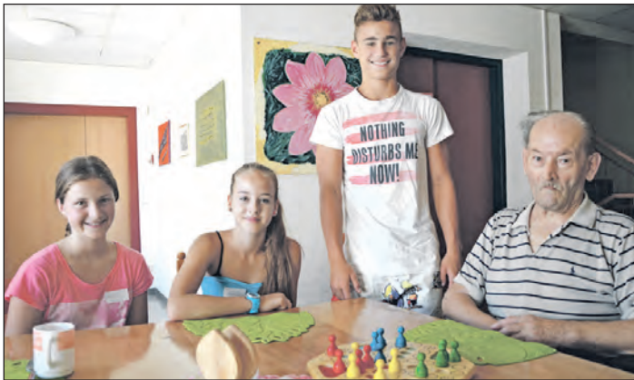
Eines der Laakirchner Jugendprojekte: Jugendliche engagieren sich beim JES-Projekt und helfen unter anderem im Altenheim mit.

Jugendliche für ihren Lebensraum zu sensibilisieren, sich für die Gemeinschaft zu engagieren und über die Grenzen Laakirchens hinaus weiterzuführen, das sind die Ziele des Jugendreferates der Stadtgemeinde Laakirchen. Zahlreiche Projekte werden umgesetzt, um die Toleranz zwischen den Generationen zu erhöhen, die Zivilcourage zu stärken und den kulturellen Austausch zu fördern.