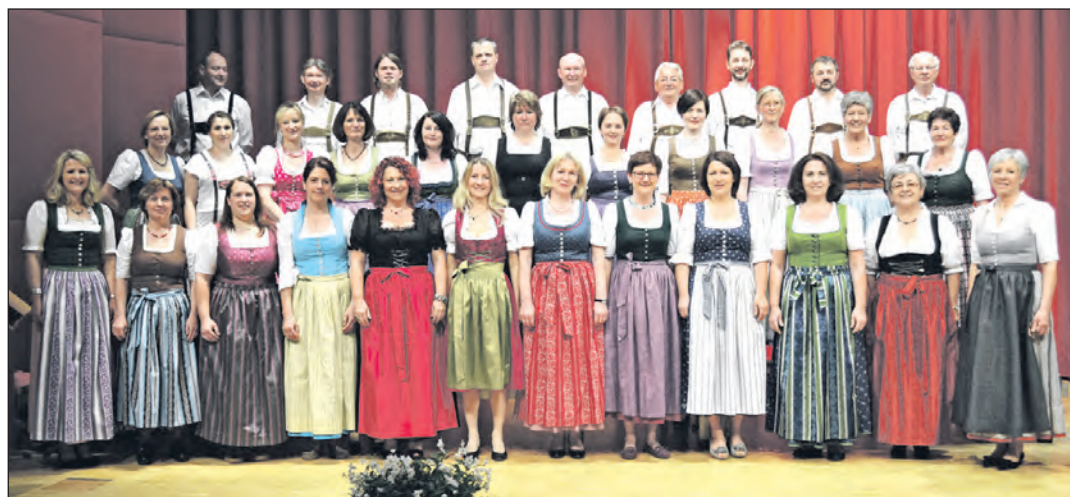
Der Berthold Chor Scharnstein feierte am 23. April beim Konzert „Eine Reise um die Welt“ sein 35jähriges Bestehen.

Jubiläumskonzert „Eine Reise um die Welt“